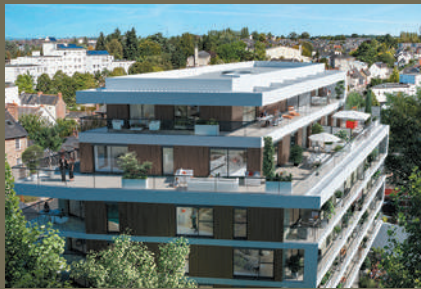
Faubourg 66 - Rennes