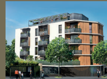
Le Georges 7 - Rennes