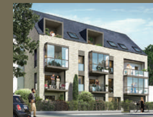
Osmose - Rennes