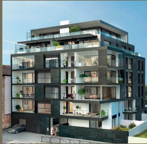
Le Parc Saint-Vincent - Rennes