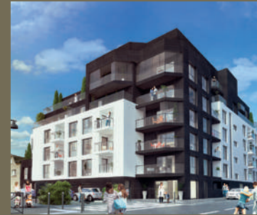
L'Atelier - Rennes