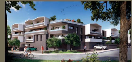
Urban Lodge - Chantepie