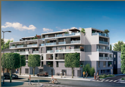
L'Escale - Rennes

Le groupe est aujourd'hui un acteur connu et reconnu pour son professionnalisme et la qualité de ses constructions.