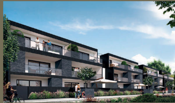
Confiance - Saint-Grégoire