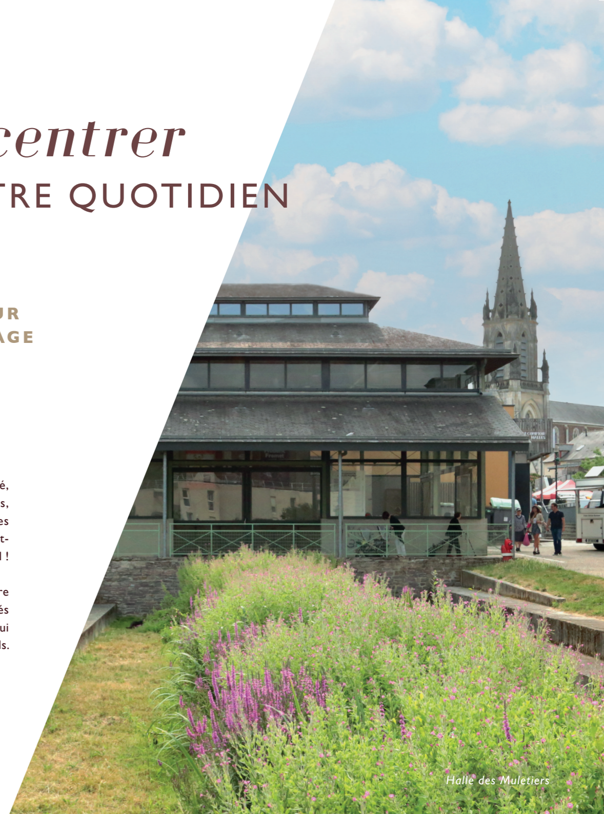
Halle des Muletiers

En flânant dans les rues, on découvre des commerces chaleureux, des cafés animés et des artisans talentueux qui perpétuent les savoir-faire traditionnels.