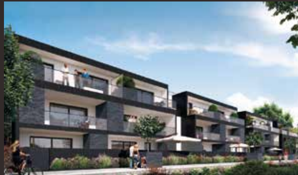
Confidence - Saint-Grégoire