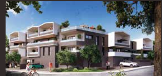
Urban Lodge - Chantepie