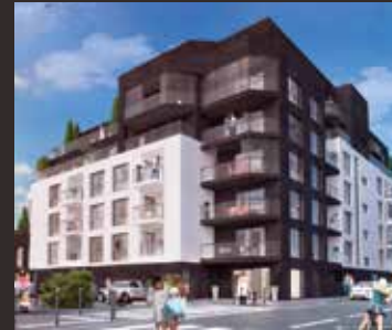
L'Atelier - Rennes