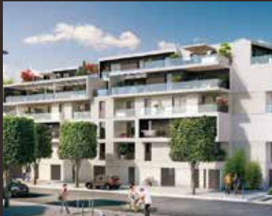
L'Escale - Rennes

Le groupe est aujourd'hui un acteur connu et reconnu pour son professionnalisme et la qualité de ses constructions.