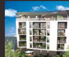
Le 214 - Rennes