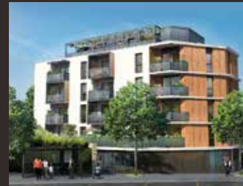
Le Georges 7 - Rennes