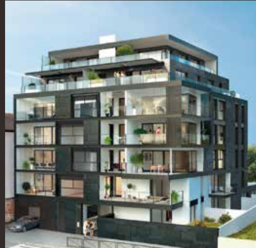
Le Parc Saint-Vincent - Rennes