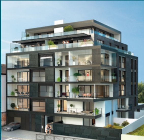
Le Parc Saint-Vincent - Rennes

Le groupe est aujourd'hui un acteur connu et reconnu pour son professionnalisme et la qualité de ses constructions.