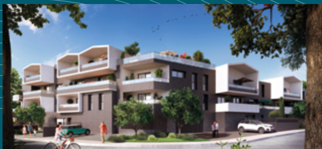
Urban Lodge - Chantepie