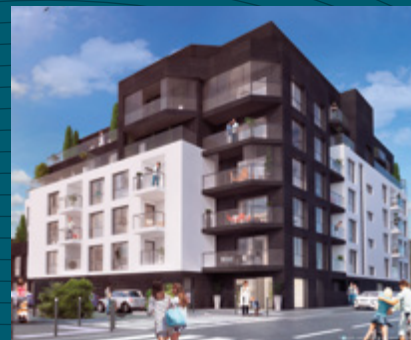
L'Atelier - Rennes