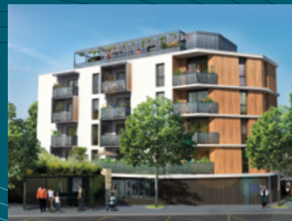
Le Georges 7 - Rennes