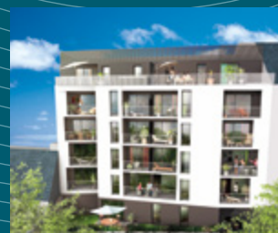
Le 214 - Rennes