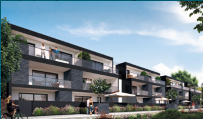
Confidence - Saint-Grégoire